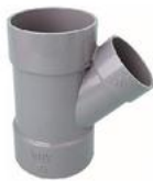
(Y (径違い) )