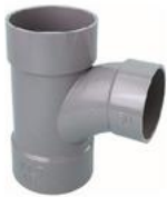
(LT (径違い) )