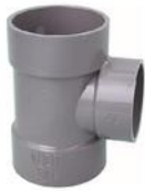
(DT (径違い) )